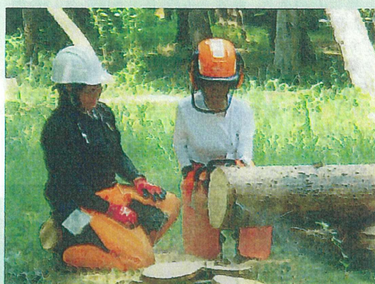
チェーンソーの操作体験