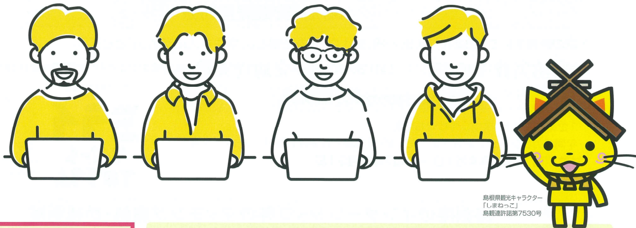
島根県観光キャラクター 「しまねっこ」 島根連許証第7530号

島根県内のIT企業で5日以上のインターンシップに参加することで、県内IT企業の魅力を学ぶとともに、Ruby・JavaなどのIT関連技能を身に付けることができます