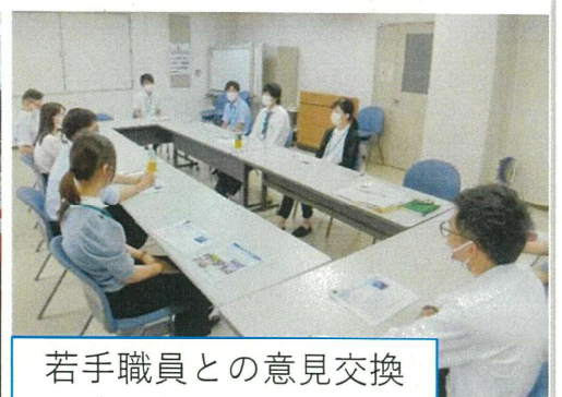
若手職員との意見交換