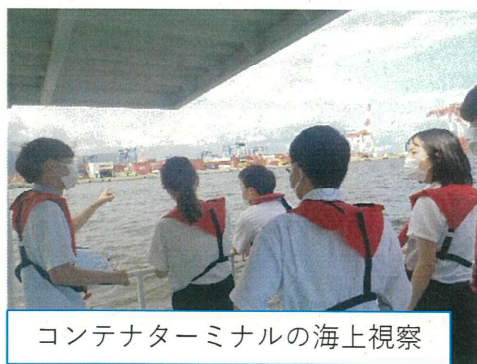
コンテナターミナルの海上視察