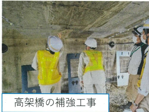
高架橋の補強工事