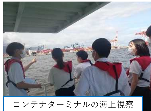
コンテナターミナルの海上視察