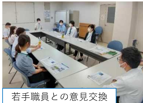
若手職員との意見交換