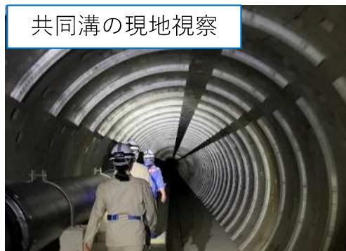
共同溝の現地視察